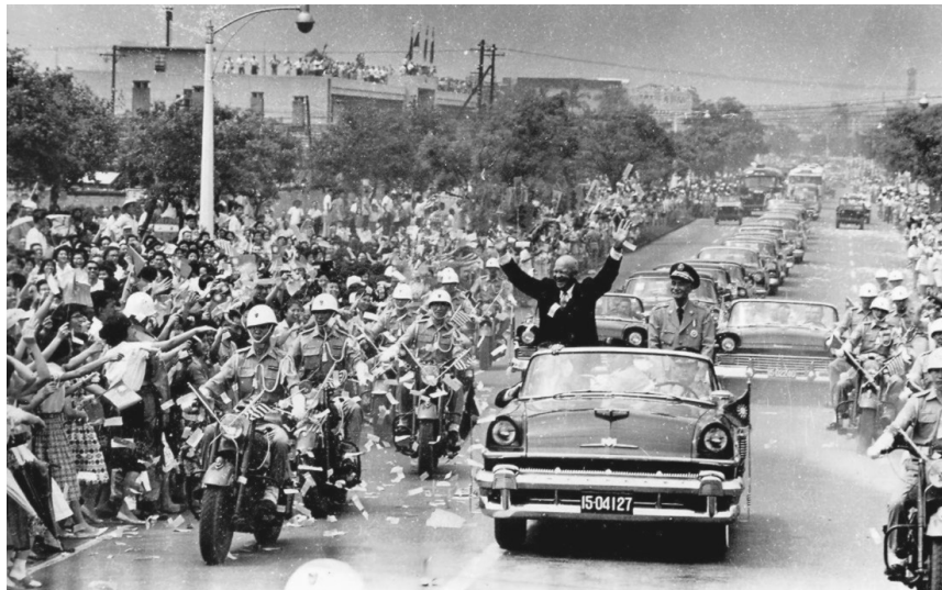
美國總統艾森豪於 1960 年 6 月訪問臺灣

1890 年在我們達拉斯北邊的丹尼森鎮，艾森豪誕生於一個德國移民後裔的基督教新教再洗禮派門諾會基督教家庭，西點軍校畢業，是美國第 34 任總統（1953 年—1961 年），他是美國陸軍五星上將，曾經是第二次世界大戰期間盟軍在歐洲的統帥。在他的領導下盟軍打敗了納粹德國和希特勒。