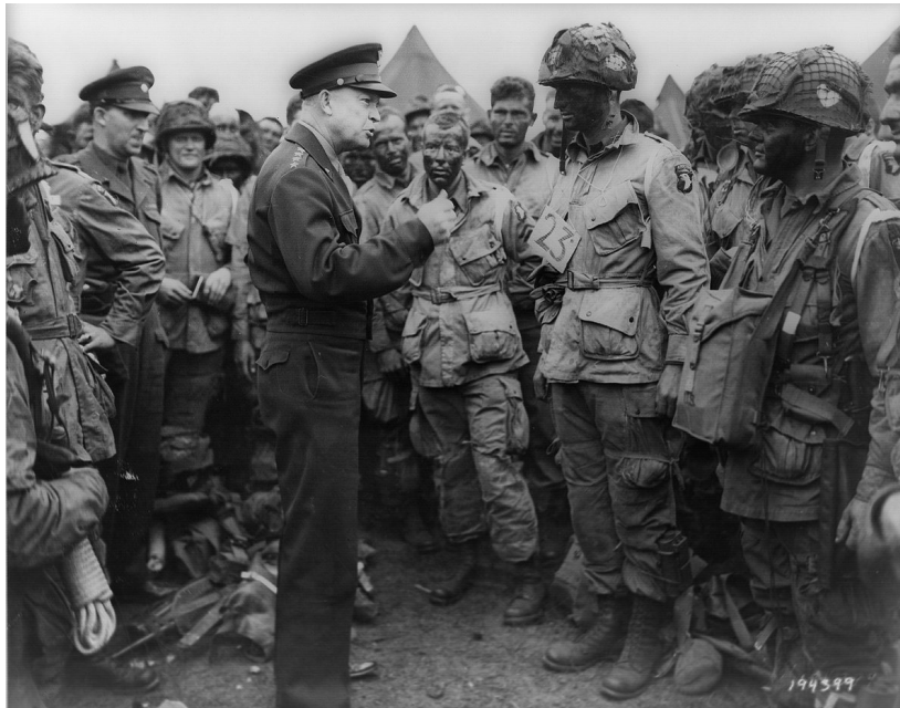
聯軍統帥艾森豪在諾曼弟登陸前一天激勵美 101 空降師官兵

善念不是想來就來，想走就走的，那是要時時處處去積累、去儲存，才能在關鍵的時刻不加思考的使用。