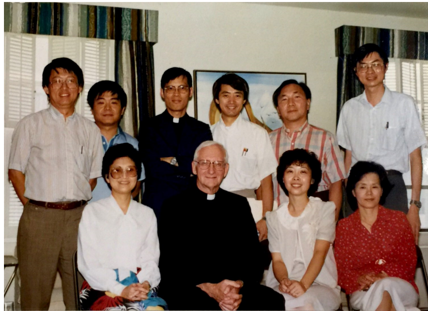
First Working Team of Dallas Chinese Catholics (1987 July) 第一屆幹事