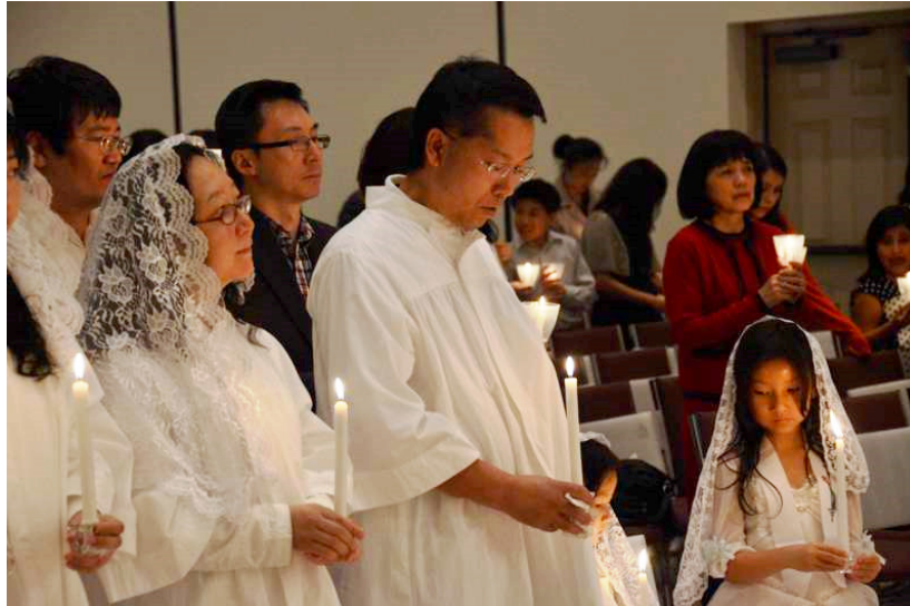
作者（左一）全家人今年復活節一起受洗

上主，請讓我安靜，讓心靈的話語流出。讓所有此刻讀這些話語的教友、朋友、和此刻的我，一起感受主耶穌基督的美善、公義、包容，愛與真正的廣大。他是我們萬物的主宰，生命的創造者，生命的救贖和生命的皈依！哦！我的上主！我的心是那樣的激動，當我呼喚你的名字，求你牽著我和我所有伙伴的手，去做合你心意的人！