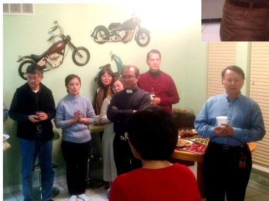
祈禱下，和諸親好友一起遍嚐美酒佳餚、唱卡拉ok、跨年倒數，齊心送舊迎新，迎接美好的2015的來臨。