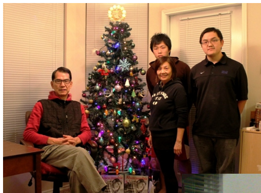
2014. 12. 24. 如今，孩子們都長大了，舉家搬來達拉斯，全家團圓、美夢成真。